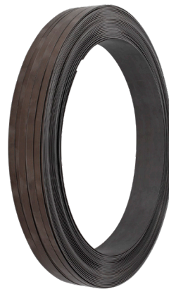
FLEJE DE ACERO PAVONADO 1/2" DE 30 KG CLAVE: SM2002