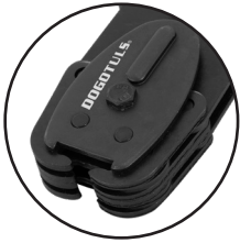
SELLADORA PARA FLEJE DE ACERO 1/2" D2 CLAVE: NH2045