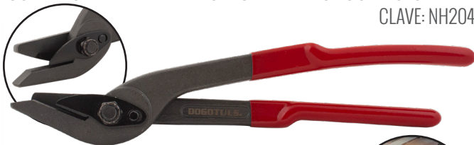
CORTADORA DE FLEJE DE ACERO PARA ANCHOS DE 3/8" - 1-1/4" CLAVE: NH2046