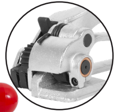
FLEJADORA PARA FLEJE DE ACERO 1/2" D2 CLAVE: NH2040