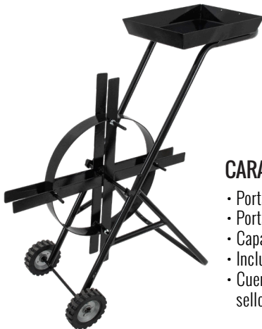
PORTA ROLLO METALICO PARA FLEJE DE ACERO 1/2" CLAVE: CP2106